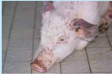
Roșeață a pielii