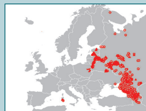
European Commission og OIE. ASF i vild- og tamsvin 2007 – 2016

Smitten kan overføres ved fodring med ukogt slagteaffald, kød eller kødaffald, der indeholder virus eller via dyretransporter. Fra grisene smittes, til de viser sygdomstegn, går der oftest 5-10 dage. Sygdomstegnene er næsten de samme som ved klassisk svinepest: stor dødelighed, høj feber, voldsom diarré og røde eller blålige misfarvninger i huden.