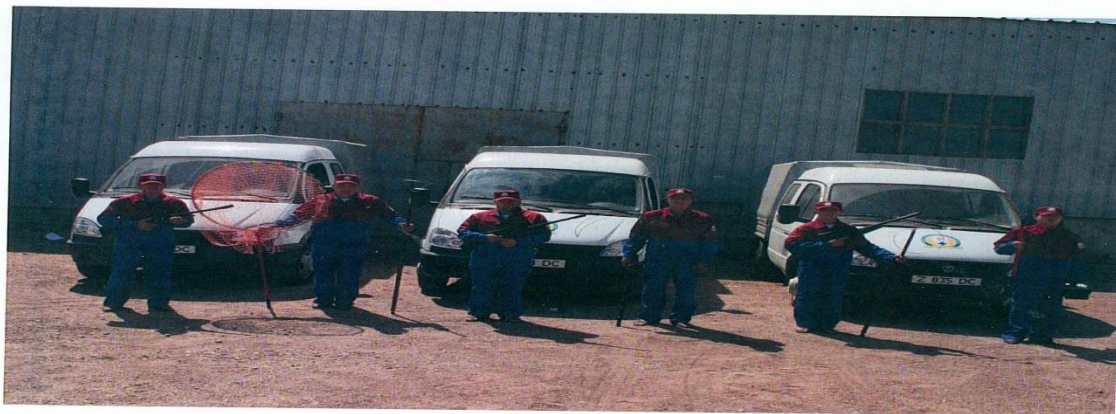
Работники по отлову безнадзорных бродячих животных