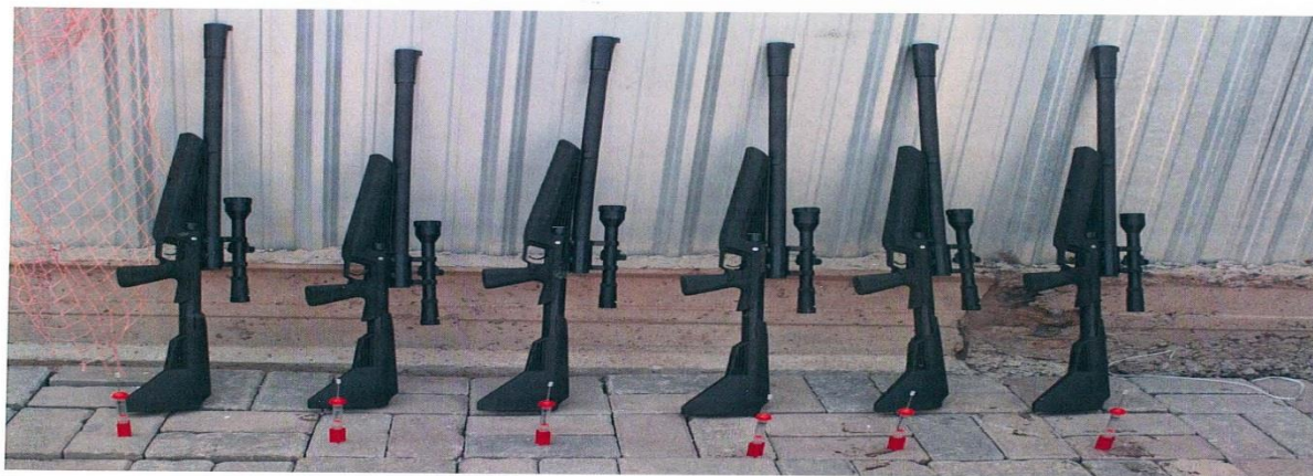
Шприцеметатель марки УВШ 3